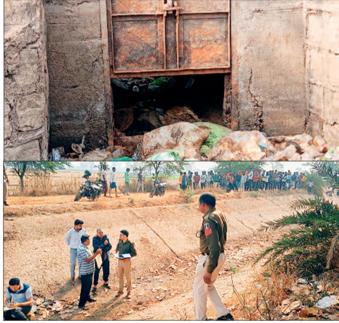
पहनकर निकली थी। चप्पल भी वही पड़ा था। फिर तो दहाड़ मारकर रोने लगी।